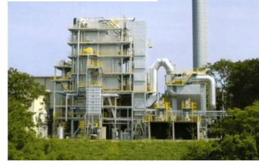
木質バイオマスリサイクル施設 (パンフレットより)

ます。1万世帯分に相当する電気が木質バイオマスで発電され、大部分を売電しています。