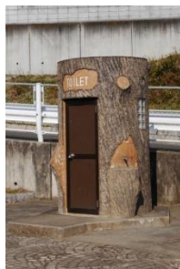
公園トイレの外観（右）と天井の電灯がつかず、暗かったトイレの内部（左）