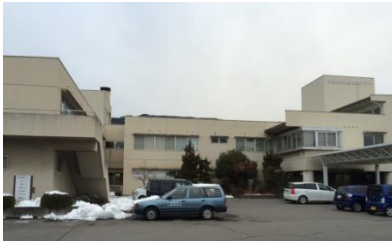
稲荷山医療福祉センター外観

◆障害児・者入所施設 ◆生活介護（障害者通所施設） ◆医療型児童発達支援センター（就学前の障がい児保育） ◆ショートステイ ◆外来診療（小児科、障がい者歯科、リハビリ科、整形外科、内科） ◆特別支援学