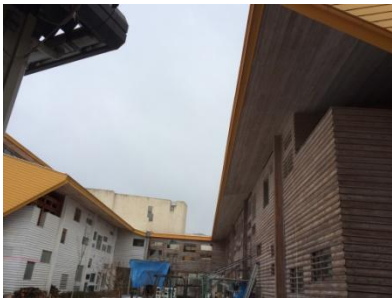
県産木材を使った特別支援学校