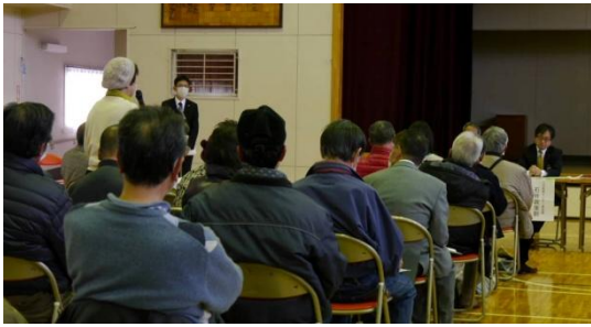
県当局（右奥）に回答を求める参加者（左）

この説明に参加者からは「小児と高齢者は違う。どう連携図るか」「県が支援して小児科、小児救急を設けてほしい」「土屋小児病院は医師が辞めている。東部北地域では小児の救急・入院・NICU必要」など小児救急、小児医療の充実を求める切実な声が相次ぎました。