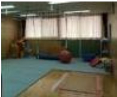
力を入れているリハビリ（写真は作業療法室）