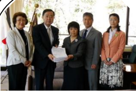
署名を渡す市議員と船橋中野市長

3月議会では2016年度予算の審議が行われ、ようやくエアコン設置の予算が盛り込まれました。2017年の1月から5月中の休日に工事が行われ、6月には稼働予定です。