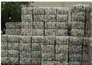
圧縮されたペットボトルの山