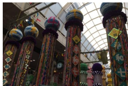
核廃絶を願って全国から寄せられた百万羽の折鶴

ハブ62戸、公営借上げ36戸、民間借上げ890戸)があり、復興は道半ばです。熊本地震の被災地にも思いをはせながらの七夕見物となりました。