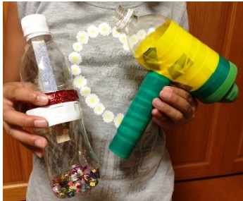
工作した空気砲 (右) と万華鏡 (左)

「想像以上にいろいろ聞くことができ、参加したかいがあった」「説明がすごくわかりやすかった」「もっとたくさんの人に聞いてもらえるといい」「ゴミは減らす努力をしなければと改めて思った」といった感想をいただき、好評でした。そのうち第2弾を企画したいと思えます。活動ニュースで告知しますので、ぜひご参加ください！