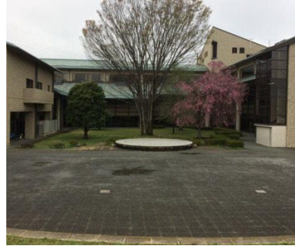
児童遊園地を整備予定の市役所中庭