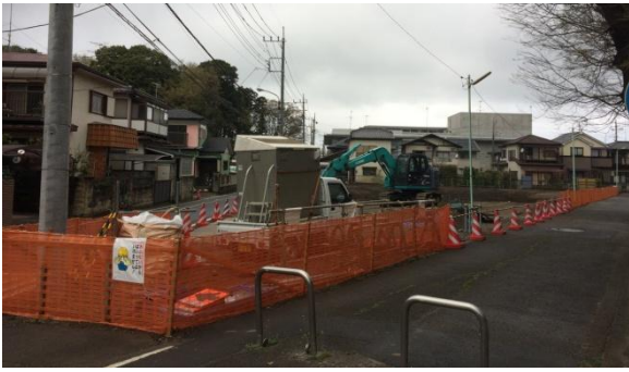
建替え工事中の中央保育園