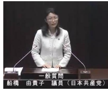
インターネットで、議会当日は中継を、1週間ほどで見ることができます。

収入が少ない家庭に対し、学用品や修学旅行費などを市が一定額援助する制度です。日本共産党市議団が長年拡充を要求し、2016年度にはPTA会費の半額が支給項目に追加されました。