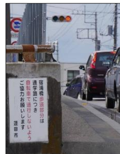
【宿浦橋】子どもが車道に降りることもあり危険