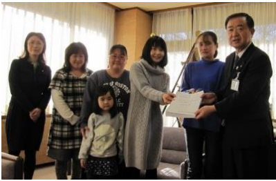
中野市長（右）に署名を手渡す保護者の皆さんと船橋（左）1月31日

「歩道が狭いので、子どもが車道に降りて前の子を抜かして行く」「傘をさしている時は車とぶつかりそうになる」「降雪時には滑ってしまう」「これから先、子どもたちが事故で