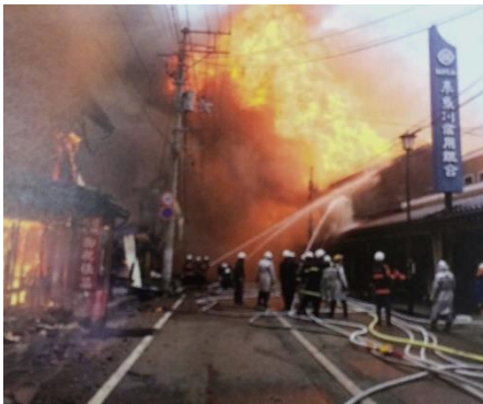
高い火柱が上がる糸魚川の大火事

大火の時は「要請が遅い」という指摘もあったが、大火後は応援要請がなくとも情報を広めて出動体制がとれるようになったそうです。