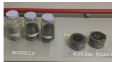
左から焼却灰、溶融スラグ（粉碎前後）、スラグ入りアスファルト、スラグ無しアスファルト

が、国基準は「製品として100ベクレル/kgなら使用可」です。福島市の現在のスラグは基準値以下ですが、買い取り業者がおらず再利用ができない状態が現在も続いています。ゴミを通じて、原発事故の爪痕が今も生々しく続く福島の実状を垣間見ました。