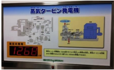
焼却炉 2 基で最大 5100kw の発電。 近隣施設にも熱供給しています。

1月22日、23日に蓮田白岡衛生組合議会の行政視察があり、福島市のあらかわクリーンセンターと、宮城県名取市の中川製袋化工（蓮田白岡のゴミ袋製造）を視察しました。 【あらかわクリーンセンター】 視察項目の中で私が気になったのは「焼却灰の再利用」です。福島市では2011年の原発事故前から焼却灰をガラス状のスラグにしてアスファルトなどの材料として再利用して行きました。しかし原発事故後、スラグから放射性物質が検出されてしまいました。国基準が妥当かは議論の余地があります