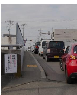
【宿浦橋】 子どもが車道に降りることも危険

を進めていくべき」と求めるのと、「まだ余裕があると考えている」との答弁でした。市長に「通行止めの最後のチャンス逃さないよう予算付けを」と求めると、市長は「内部協議をもっとして結論出す」と答弁しました。通学路でもあり、子どもたち、市民の安全を確保する人道橋設置を進めるべきです。