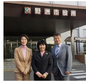
野洲市役所1階入ってすぐに「市民生活相談課」があります

判断とのこと。法律通りなら差押えとなる事例でも、生活再建を支援することで税の自主納付が進み、年間約3千万円の税収入になったそうです。