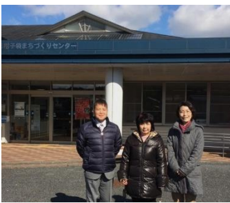
市民の協同出資による太陽光発電所を設置した公共施設

また、出資以外にも市民が参加できるよう、連続講座から派生した「 イモ発電 」が研