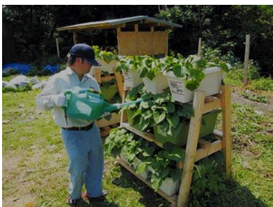
イモの空中栽培（収穫量増・畑と違い車椅子でも参加できる）。水をやる障がいのあるスタッフ（資料より）

単にハード面の発電を推進するだけではなく、地域経済の活性はもちろん、福祉的・農業的・住民自治的視点などで自然エネルギーを活用したまちづくりが進められており目から鱗でした。