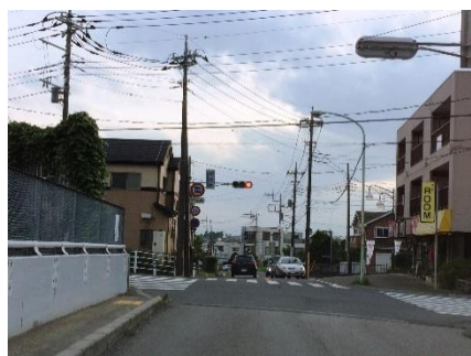
黒浜から駅方面を見た宿浦橋交差点

担当参事は「岡の島子ども会、殖産子ども会から平成29年1月31日に568名の要望署名いただいた。今年4月27日にネクスコ東日本へ相談に行った。蓮田新SAの工事で一夜间交