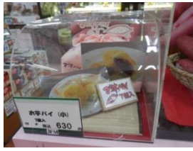
蓮田SA限定お芋パイ