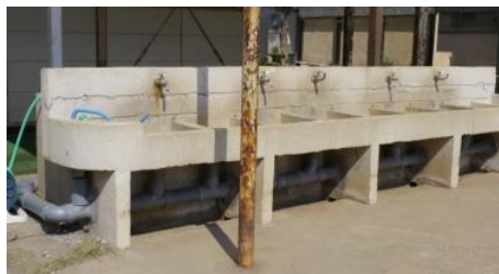
下の排水管が整備されました