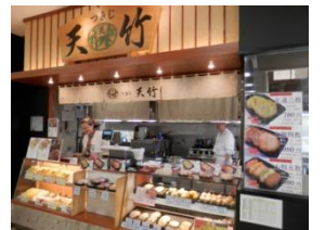
「つきじ天竹」では焼き鯖寿司も買える