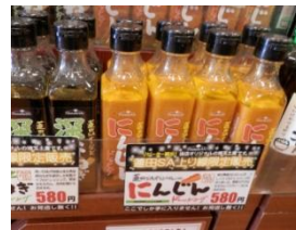
蓮田上りSAオリジナルドレッシング