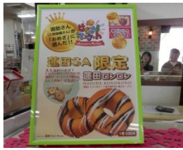
「おめざ」に選ばれた蓮田ロンロン

東京のお土産が中心。揚げないドーナツ「蓮田ロンロン」はTVでも紹介された当店限定品。「お芋パイ」は紫芋のあんが美味。