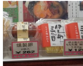
蓮田の「伊之助三代目」ラーメン

近いのに意外と知らない蓮田サービスエリアに行ってみました。各地のお土産品のほか蓮田SA限定品もあり、美味しく楽しい買い物スポットの発見でした。