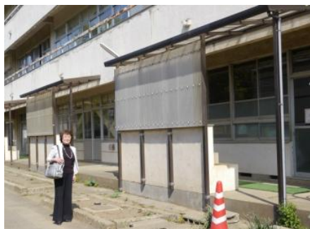
開設予定の教室横に立つ小山市議

すべての学童保育で実現を 引き続き、すべての学童保育所 待機児童解消、小学校4年生までの 受け入れを目指して頑張りたいと 思います。