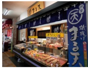
「まる天」いち押しは海鮮かき揚げ天