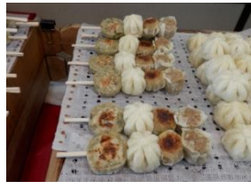
横浜中華街の味「よくばり串」が人気